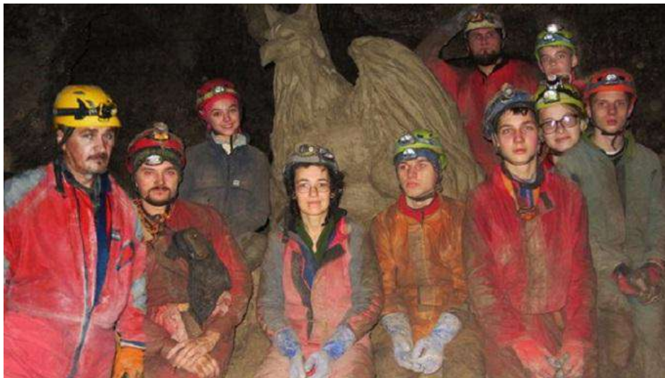
Учасники групи, що здійснила першопроходження

Щороку спелеологи відкривають нові шляхи печери за допомогою розкопок та розширення ходів її сполучення. Полтавські ж вихованці закартували до 300 підземних метрів нових ходів та відкритий прохід у ще недосліджену частину Оптимістичної. Вихованці Полтавського обласного центру туризму і краєзнавства учнівської молоді отримали право назвати один з районів печери «Сніжним». Необхідно зазначити, що на карті печери також є зал під назвою «Полтава».