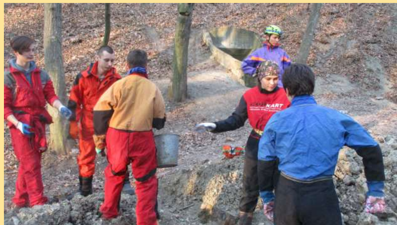
Вхід до печери Оптимістичної, роботи поруч по благоустрою, 2019р.

( http://optimistychna.com/ru/news-ru/world-longest-handmade-roads/ ).